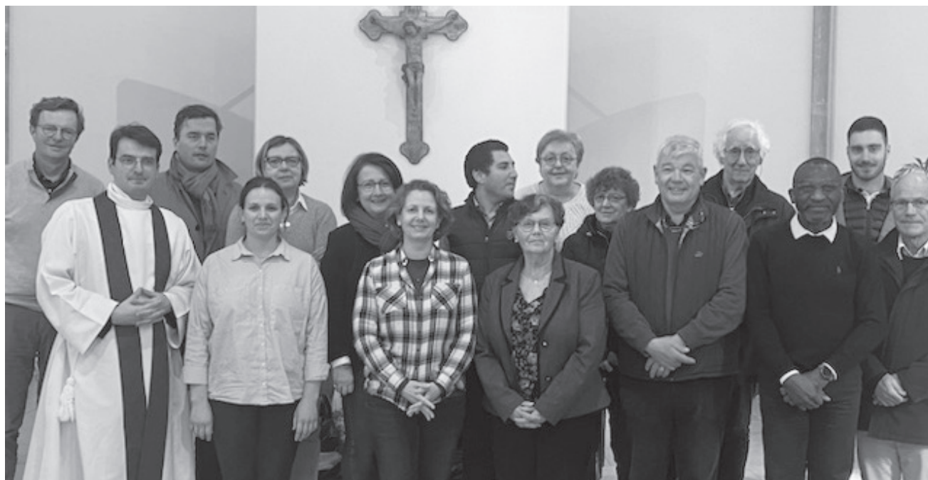
Membres du nouveau conseil (de gauche à droite)